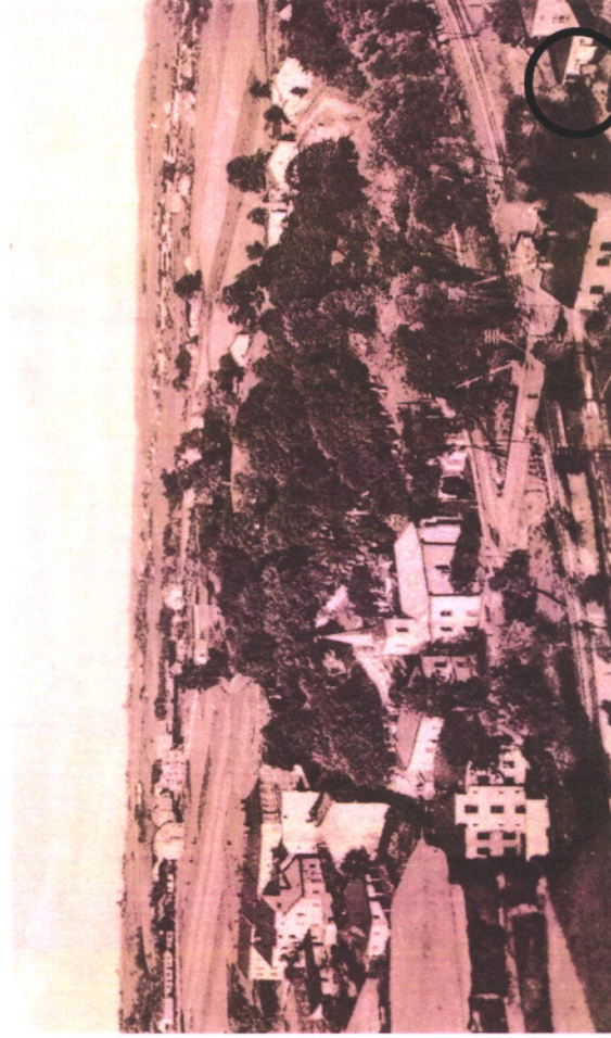
Archiwalna fotografia z ok. 1920-1930 r. XX wieku przedstawiająca widok na kościół pw. św. Jerzego (w okręgu zaznaczono fragment przedmiotowego budynku widoczny na zdjęciu wykonywanym z Wieży Piastowskiej)