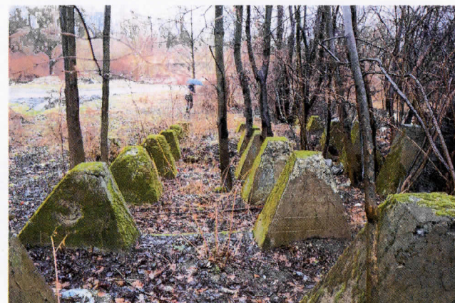
Widok w kierunku południowo-wschodnim.