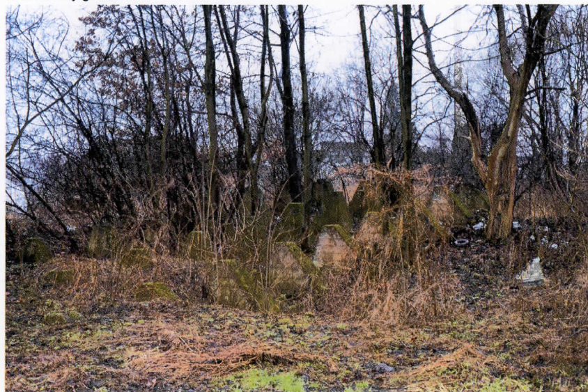
Widok od strony północnej.