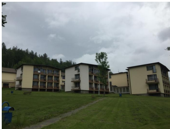
ul. Turystyczna 6, widok od strony południowej