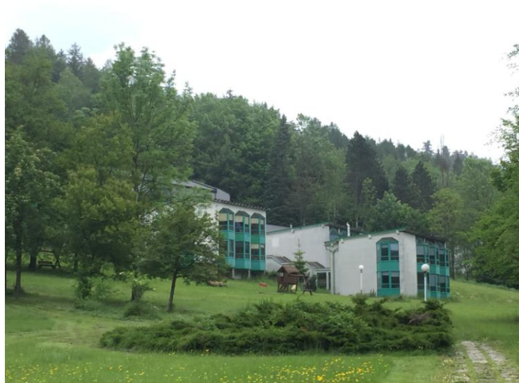
ul. Turystyczna 8, widok strony południowej