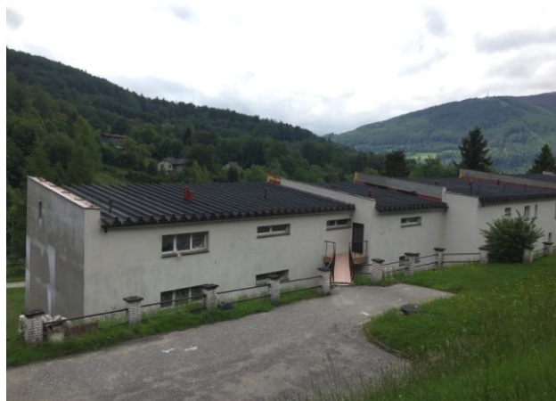
ul. Wczasowa 49. Widok od strony północnej