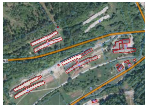
Mapa w skali 1:5000