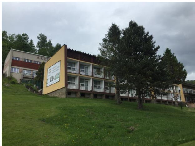
ul. Wczasowa 49, widok od strony południowej