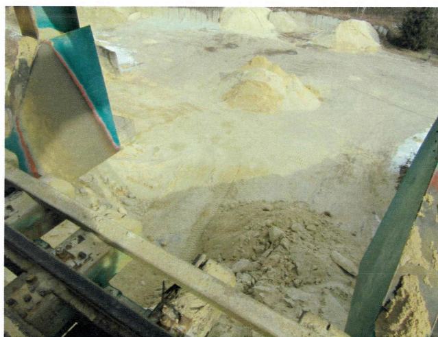
widok w kierunku pn.-wsch.