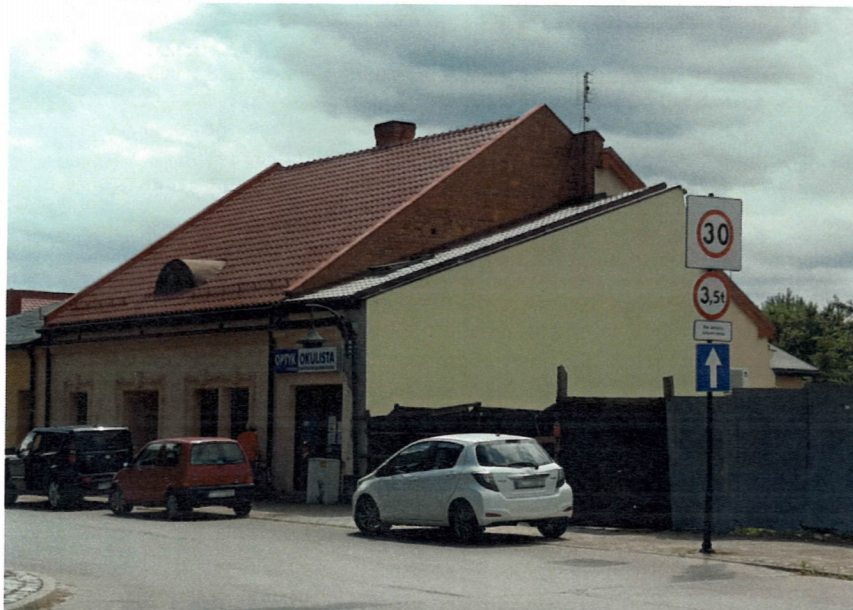
widok na „miedzuch” oraz kamienicę Rynek 14